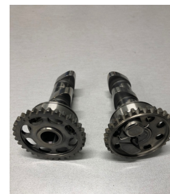
Arbre à cames